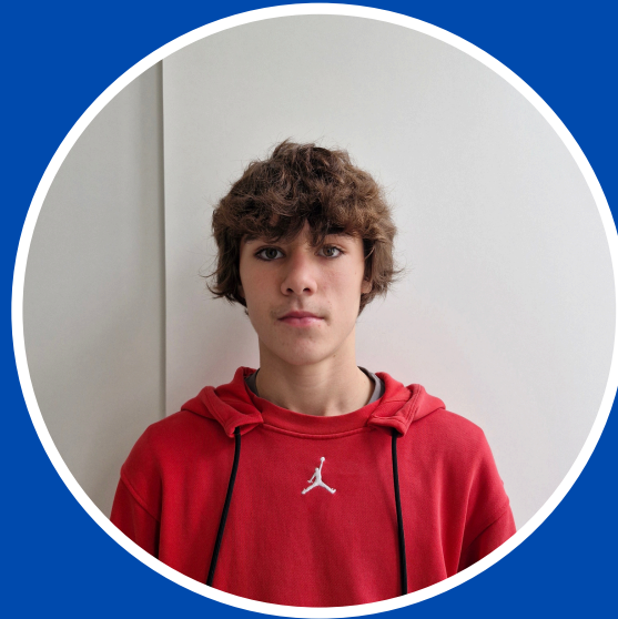
Santiago Bobo Team Lider

Formamos un gran equipo distribuidos en distintos departamentos: